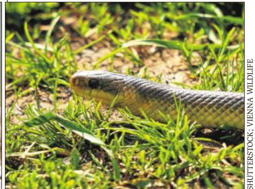
SHUTTERSTOCK: VIENNA WILDLIFE

Rund acht Millionen Menschen nennen Österreich heute ihr Zuhause, 1,8 Millionen davon leben alleine in Wien. Wie viele Tiere das Land bevölkern, ist weitaus schwieriger zu ermitteln. Von Haustieren wie Hunden, Katzen und so weiter abgesehen, nehmen wir zumeist gar nicht zur Kenntnis, wel-